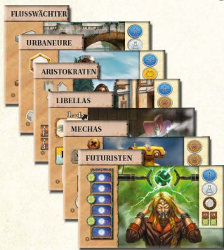
6 neue Gemeinschaften