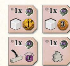
4 Kompetenzplättchen der Libellas