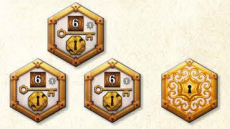
3 neue Stadtmarker (gleich)