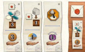
3 neue Rundenboni